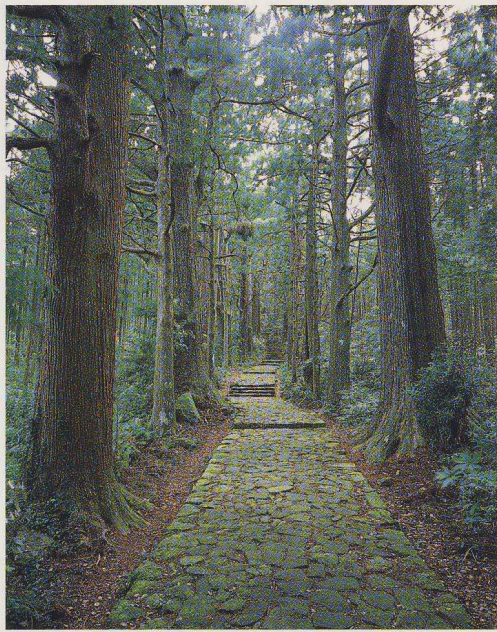
いしだみ だいもんざか 杉並木と石畳が美しい那智山大門坂