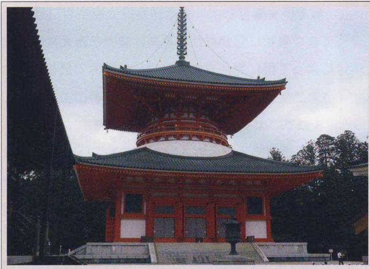
金剛峯寺根本大塔

高野山は紀伊山地北部の海拔約800mの山上に位置し、八つの峰々に囲まれた東西6km・南北3kmの盆地で、日本を代表する山岳霊場です。空海(774~835)が816年に金剛峯寺を創建して以来、真言密教の根本霊場として全国的な信仰を集めてきました。山上には、現在でも金剛峯寺と117ヶ寺が密集し、1200年もの歴史を秘めた山岳宗教都市としての文化的景観を作り出しています。また、国宝